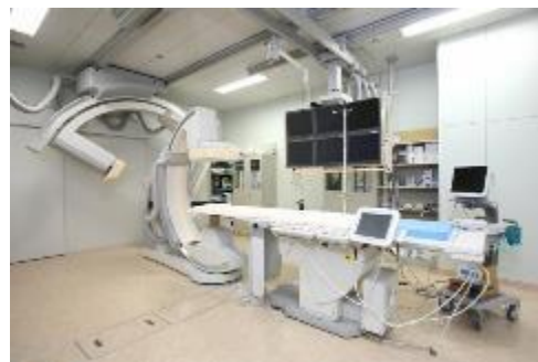
医療用大型設備・備品