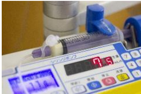
医療機器・消耗品