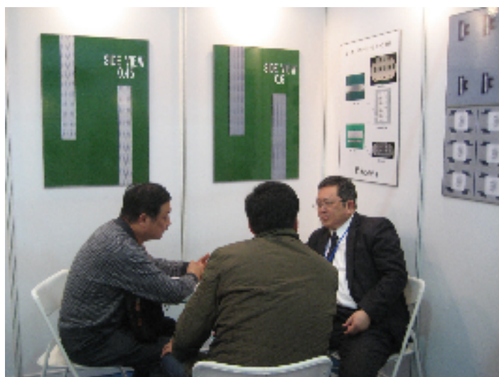
(株)セントラルファインツール (恵那市)