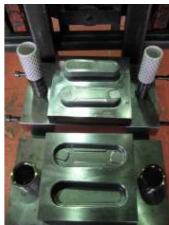
半年がかりで組み上げた金型