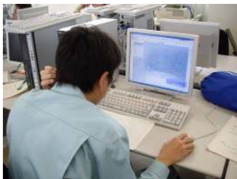
CADを使った設計にも取り組んだ