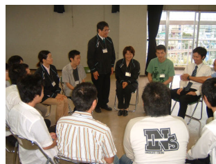
ゲーム形式による講座②