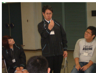
ゲーム形式による講座①